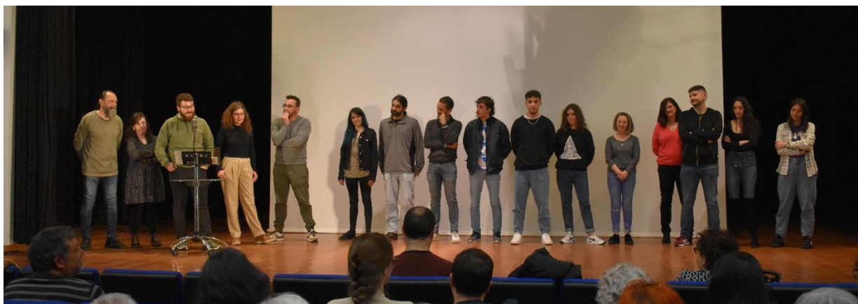
As xentes do común que van defender un programa de goberno que coloca a vida no centro.

A continuación pódese atopar o compromiso de Pontearreas en común, un contrato coa xente do común para construír unha Pontearreas que non deixa a ninguén atrás, que escoita, que participa e que loita por todos os dereitos para todas as persoas.